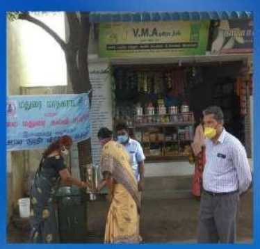
NEHRU NAGAR BYE PASS ROAD