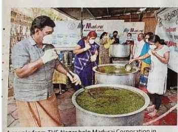
A couple from TVS Nagar help Madurai Corporation in

A couple from TVS Nagar have been helping Madurai Corporation by preparing 2,000 litres of kabasura kudineer concoction everyday for the past 70 days. While the Corporation