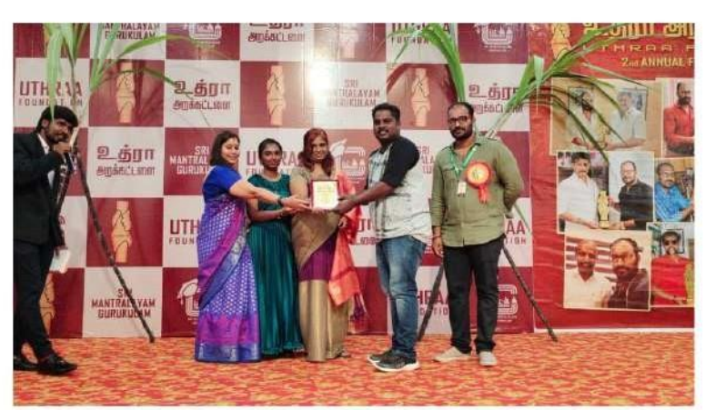
tomil thei & mutamil Award