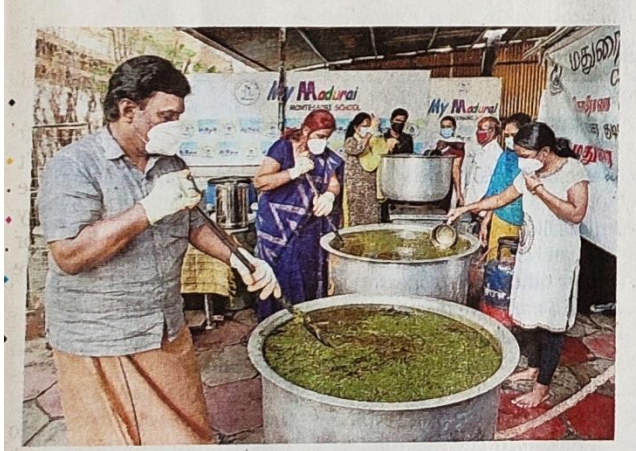
A couple from TVS Nagar help Madurai Corporation in preparing 'kabasura kudineer' everyday.