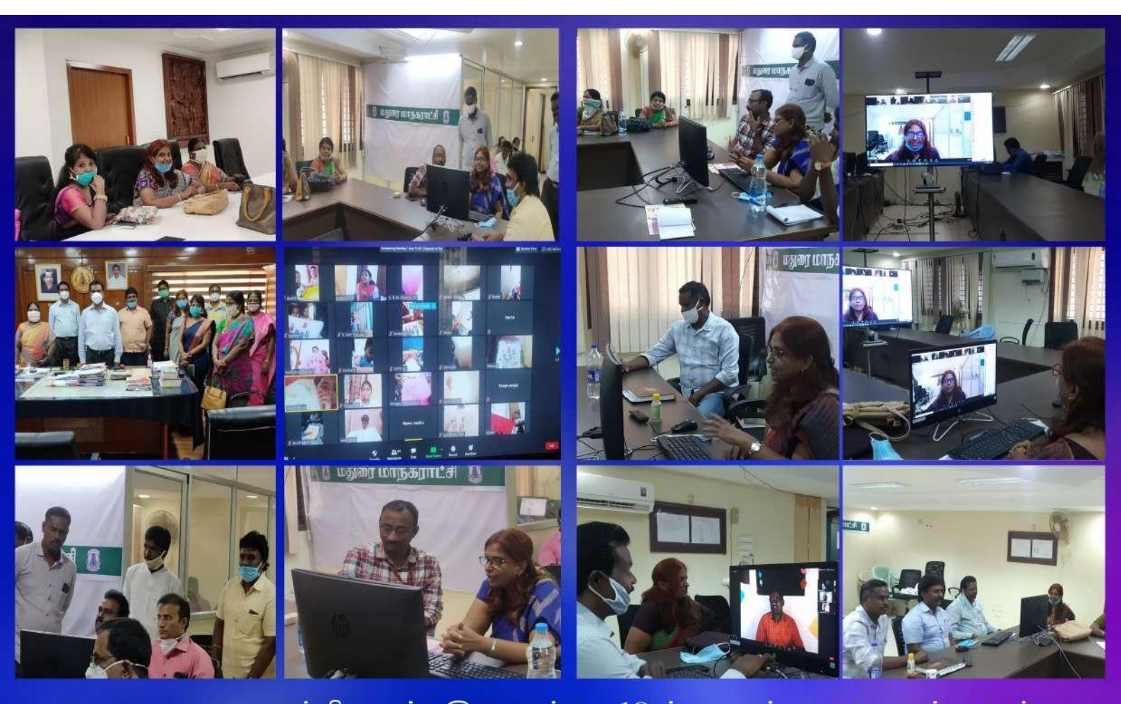
மதுரை மாநகராட்சியுடன் இணைந்து 10-ம் வகுப்பு மா<mark>ணவர்களுக்கு</mark> தளிர்திறன் பயிற்சி அளித்த போது